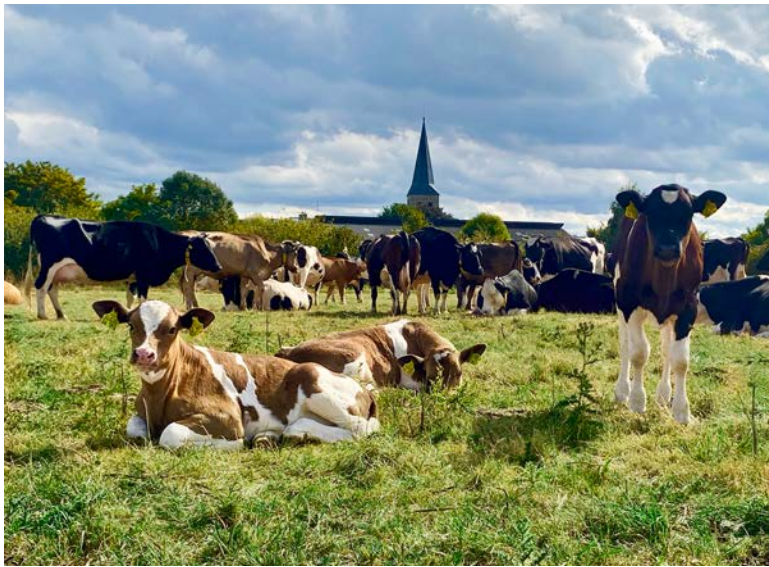
Vormals reine Milchbetriebe in Voerde setzen heute auf Mutterkuhhaltung und Direktverkauf.