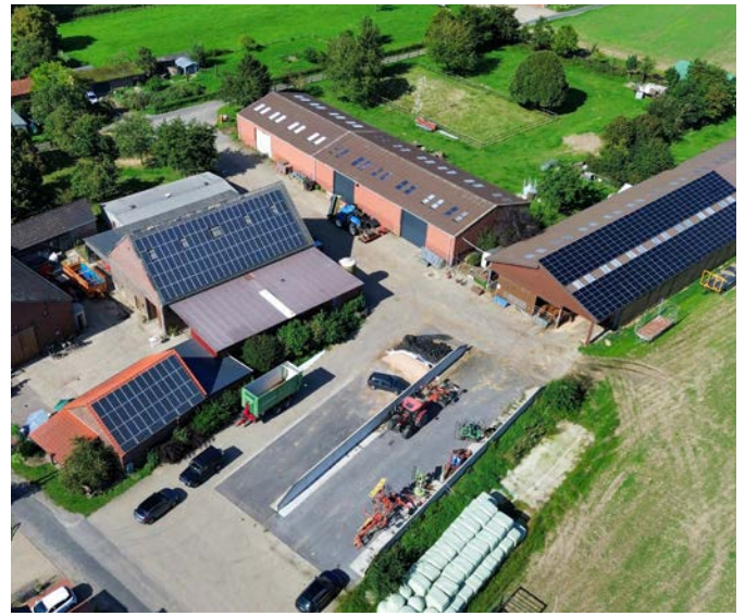
Viele Landwirte nutzen bereits Solarstrom für den Betrieb – und als Nebenerwerbsquelle.

plant er eine Agri-PV-Anlage über den Heidelbeerfeldern – ein Pilotprojekt im Kreis Wesel. Ob sie kommt, hängt von politischen Entscheidungen ab. „Ich investiere nur, wenn es sich auch rechnet.“